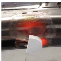
Нагрев лонжеронов (кроме сверхпрочных сталей)